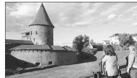
Kohoutovští ve městě Kaunas v Litvě

OSKA z.s., která má 20 členů, letos slaví už 10 let své činnosti pro zvelebení obce. První naší aktivitou v roce 2008 byla spolupráce s obcí na výsadbě aleje za hřbitovem. Tato práce už doslova přinesla ovoce a obalené třešňové stromy letos potěšily i místní děti. Pokračujeme v projektu Arboreal Futures, čtyři naše členky byly v červnu u partnerů v Litvě; i tam se sází stromky.