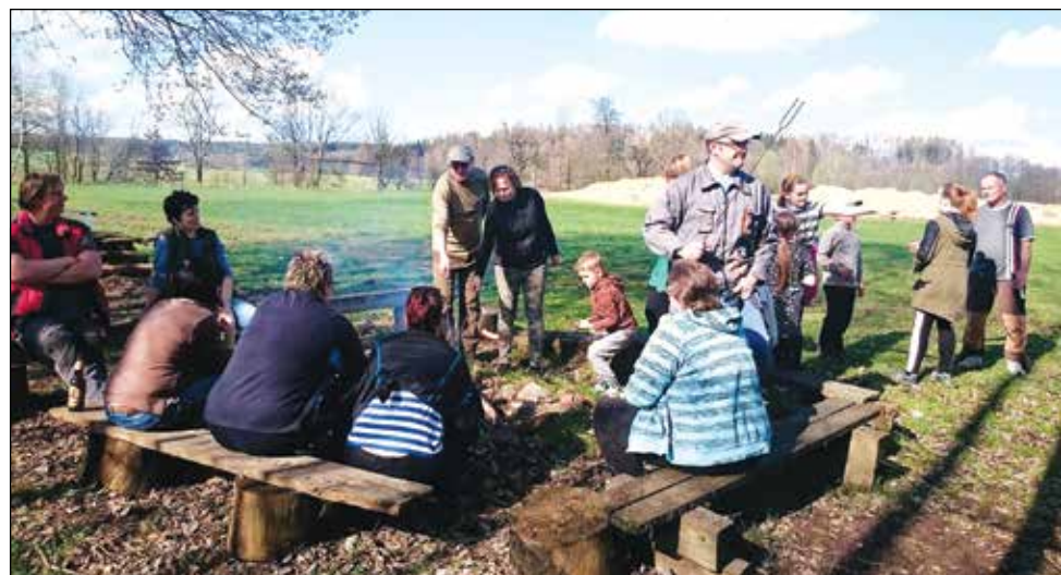
Posezení u ohně po sběru odpadků