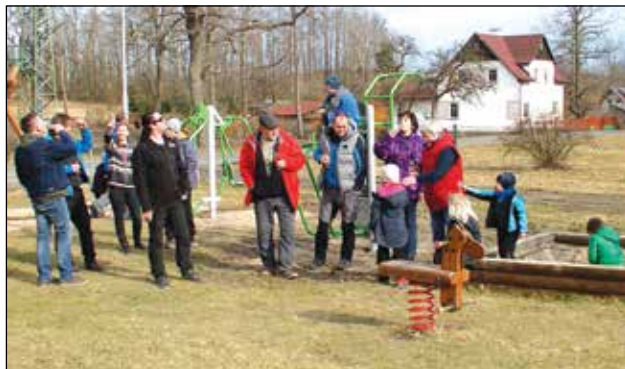
Křest prvků na hřišti