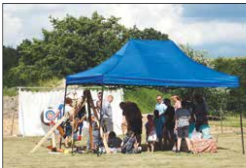
Dětský den – lukostřelba